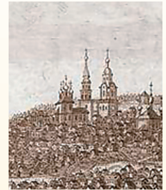
Спасо-Преображенский монастырь на гравюре середины XVIII в.

его монахи славились ученостью, и даже самое первое духовное училище (в 1730-х годах) тоже открыли спасские старцы, осуществлявшие, кроме всего прочего, общий надзор за благочиниями обширного реги-