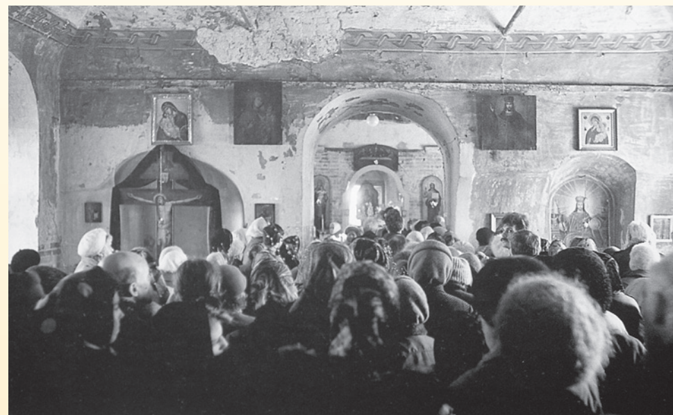
Преображенский храм возвращен верующим. Фотографии О. Санталова середины 1990-х гг.