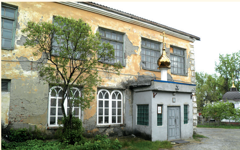
Архитектурная мастерская «Дабор». Вход в Вознесенский молитвенный дом

когда начали вбивать сваи под фундамент строящихся зданий, они стали проваливаться в могильные склепы. Тогда с помощью строительной техники на месте кладбища расчистили пространство под котлован, а сохранившиеся полуистлевшие гробы вывозили неподалеку в болотистое место, оставшееся после осушения небольшого озера, находившегося близ монастырской рощи. В остатках захоронений находили кресты, иконы, драгоценности.