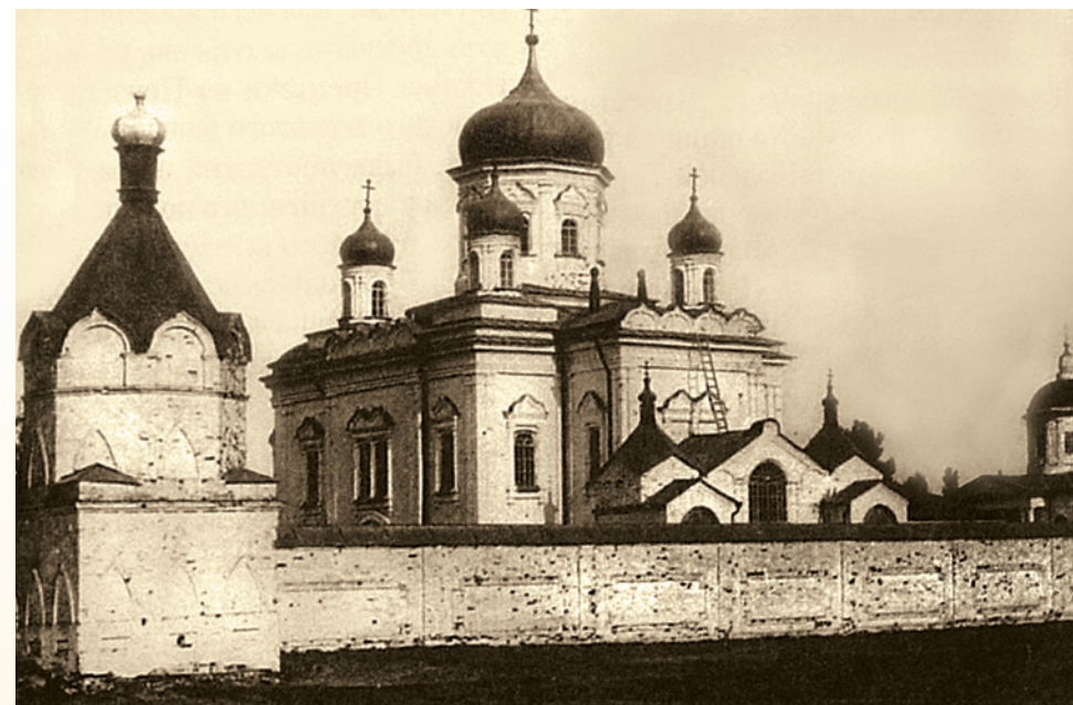
Троицкий собор Спасо-Преображенского монастыря. Фотография