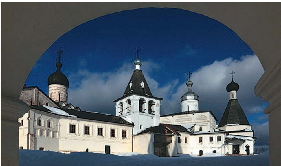
Ферапонтов монастырь. Современная фотография

мены Спасо-Преображенского монастыря вершат власть над окрестными приходами, почти как архиереи.