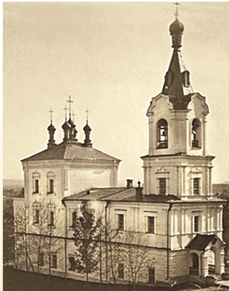
Преображенская церковь до революции. Фотография