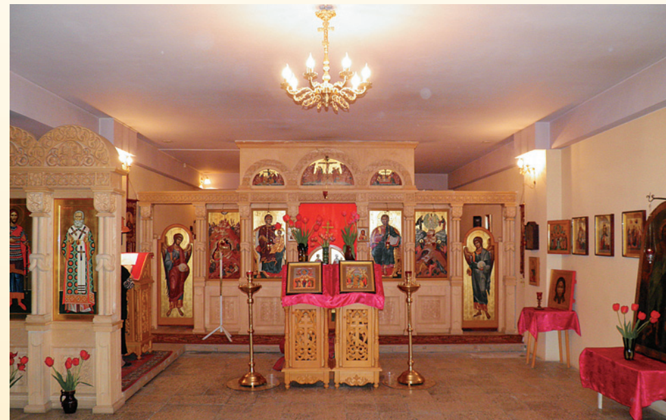
Вознесенский молитвенный дом. Интерьер