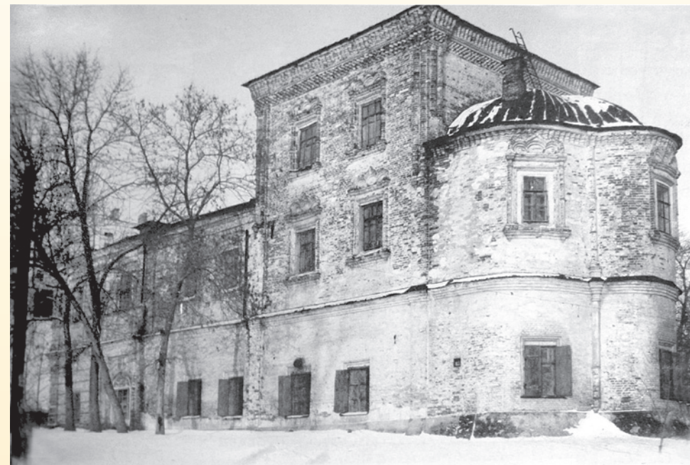
Преображенская церковь — областной архив. Фотография 1950-60-х гг.

С 2001 г. Преображенская церковь была подворьем Керенского Тихвинского монастыря, с 2008 г. – Нижнеломовского Казанского. Здесь постоянно жили несколько иноков, и, таким обра-