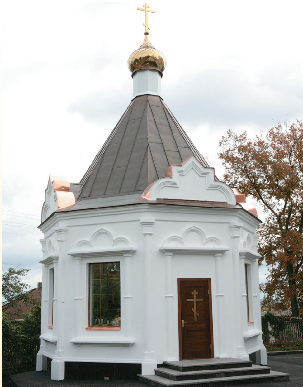
Часовня-усыпальница. 2013 г.