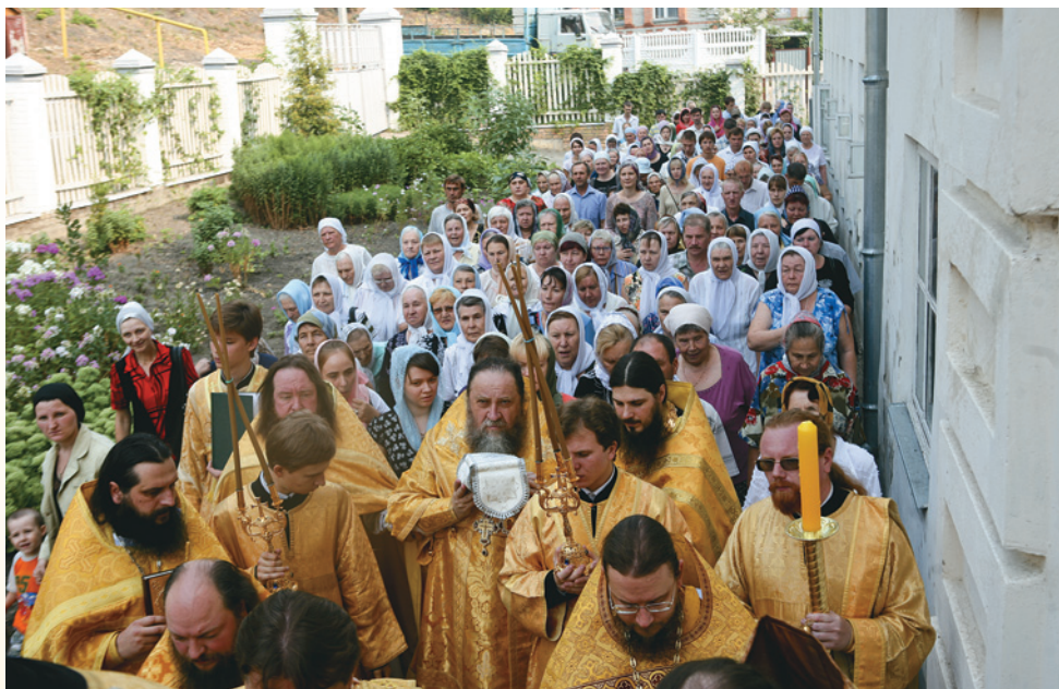
Великое освящение верхнего храма. 8 августа 2010 г.