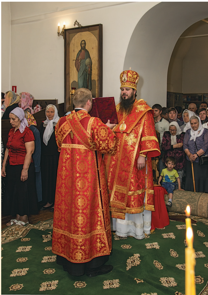
Прощальная Литургия в монастыре епископа Нестора. 23 мая 2014 г.