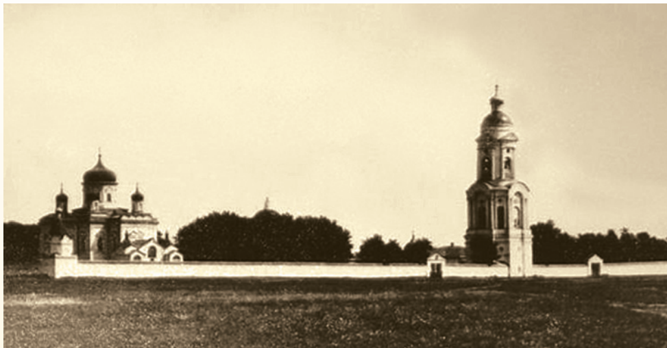
Спасо-Преображенский монастырь за городом. Общий вид. Фотография

Второй период в истории монастыря отсчитывается с конца XVIII в. 5 В 1791 г., вскоре после екатерининской перепланировки города, расположение обители на горе, в самом центре Пензы, было найдено неудобным. Кроме того, тамбовский краевед Г. Хитров глухо упоминает о ссорах и беспорядках среди братии. Он же пишет: «Город строился по новому, Высочайше утвержденному плану, по которому немалая часть монастырской усадьбы назначена была к занятию частными строениями. Для входа в монастырь оставался