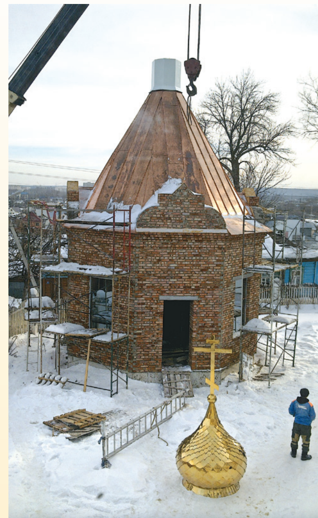
Подъем купола на часовню. 12 февраля 2013 г.

Параллельно преображался и храм. В 2013-2014 гг. была перекрыта медью крыша четверика и трапезной, расписан верхний Преображенский храм.