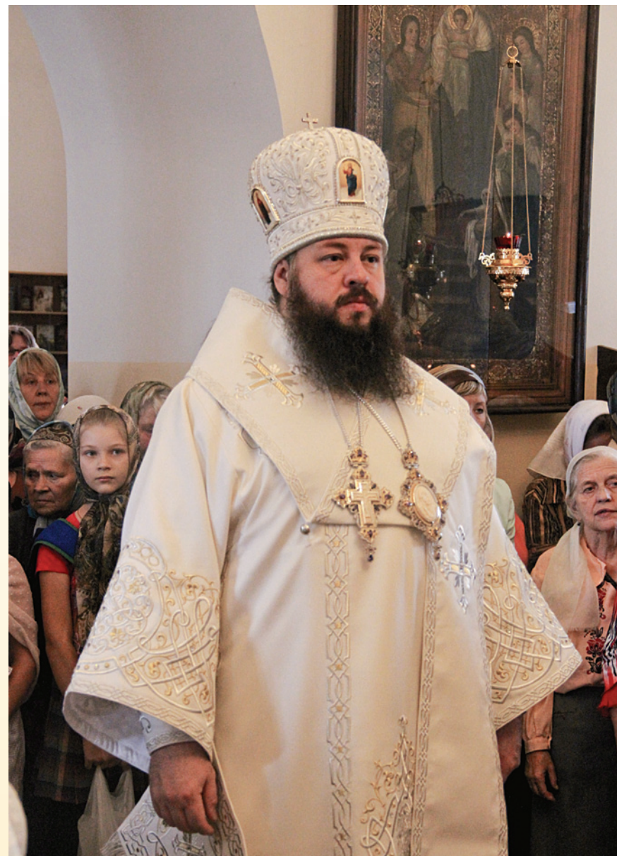
Митрополит Серафим совершает Литургию в Спасо-Преображенском монастыре. Преображение Господне. 19 августа 2014 г.