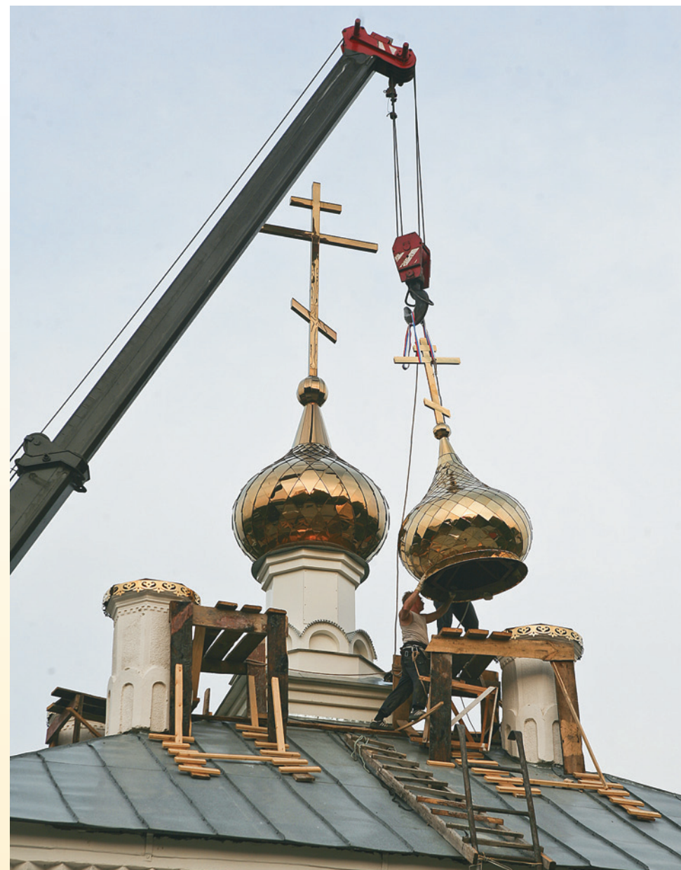
Подъем малых куполов. 22 июля 2010 г.