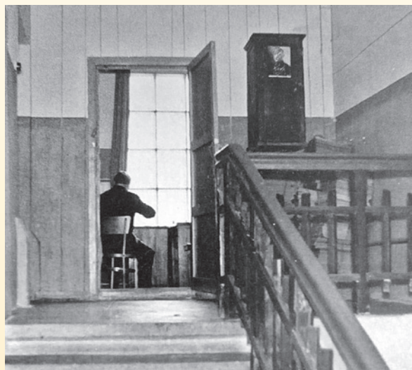
В рабочих комнатах госархива. 1967 г