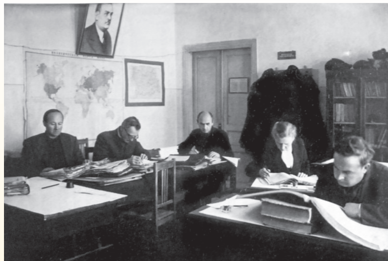
В читальном зале госархива. 1960-е гг.

зе, любимый всей православной Россией старец схиархимандрит Питирим (Перегудов, 1920-2010) из Санаксарского монастыря.