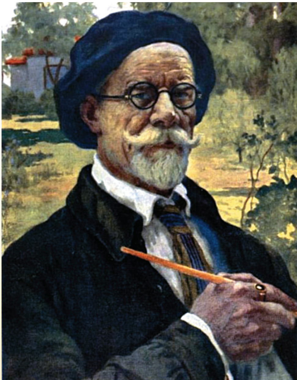
Иван Горюшкин-Сорокопудов. Автопортрет. 1920 г.