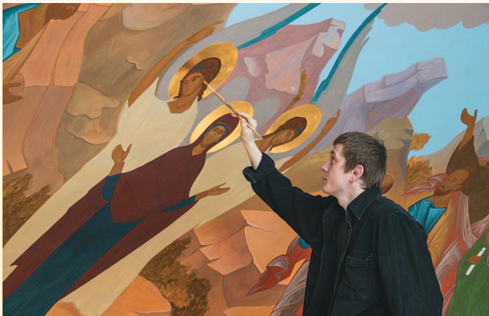
Роспись верхнего храма. Май 2014 г.

25 декабря 2013 г. священноархимандрит монастыря митрополит Вениамин, согласно решению Святейшего Патриарха Кирилла и Священного Синода, был перемещен на Рязанскую кафедру. Новым управляющим Пензенской епархией и настоятелем Спасо-Преображенской обители стал епископ Кузнецкий и Никольский Серафим.