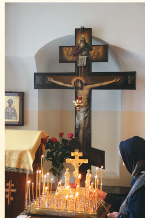
Преображение Господне - престольный праздник монастыря. 19 августа 2014 г.