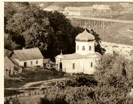
Храм Живоносного Источника. Фотография

вился еще один храм – деревянная часовня Божией Матери Живоносного Источника над святым родником. Она дважды заново отстраивалась – в 1804 г. деревянной и в 1850 г. каменной. Почитание родника продолжалось вплоть до революции, в середине 20-х гг. храм Живоносного Источника снесли. 4