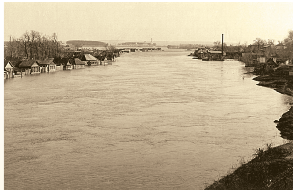
Спасо-Преображенский монастырь (вдалеке) во время разлива реки. Фотография

В сентябре 1918 года был произведен тщательный обыск в келии и канцелярии Архиепископа, не давший никаких результатов, а сам Архиепископ был увезен в Губчека на очную ставку с одним из заключенных перед расстрелом. Был вечер. В храмах начинали служить всеобщую. Когда верующим стало известно, что Архиепископ увезен в «дом, откуда не возвращаются», люди решили, что Владыка расстрелян вместе с другими заключенными. Когда архиепископ Иоанн с большим опозданием всё-таки прибыл на богослужение, то застал не всеобщую