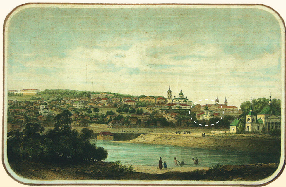
Преображенская церковь на гравюре середины XIX в.

Сохранились рассказы о том, что в начале XX в. настоятель храма планировал пригласить для его росписи великого художника Михаила Врубеля, и тот даже якобы дал согласие, но осуществить задумку не позволила болезнь и смерть живописца. Храм любил художник Иван Сильч Горюшкин-Сорокопудов, называвший этот уголок Пензы «Преображенским краем».