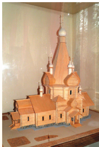
Макет Вознесенской церкви, которую предполагалось возвести на месте монастырского некрополя