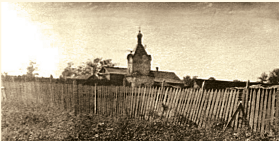
Башня монастырской ограды незадолго до разрушения. Фотография 1950-60-х гг.