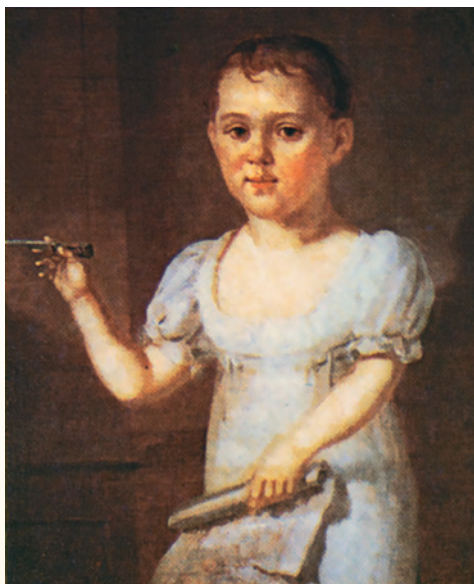
Михаил Лермонтов в детстве