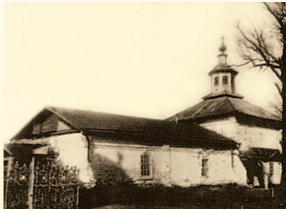
Вознесенская кладбищенская церковь (предположительно). Фотография