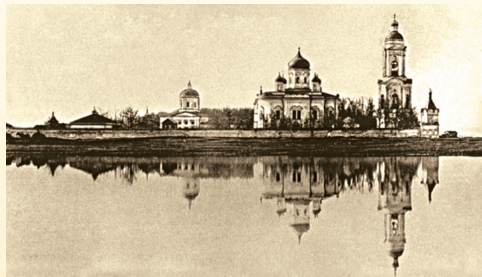
Спасо-Преображенский монастырь во время разлива реки. Фотография