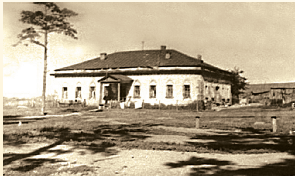
Один из монастырских корпусов незадолго до разрушения. Фотография 1955 г.