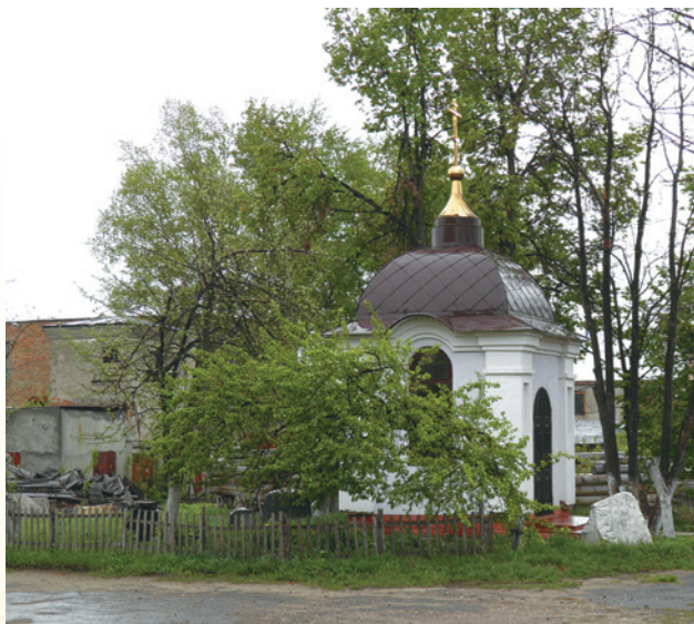
Часовня на месте монастырского некрополя