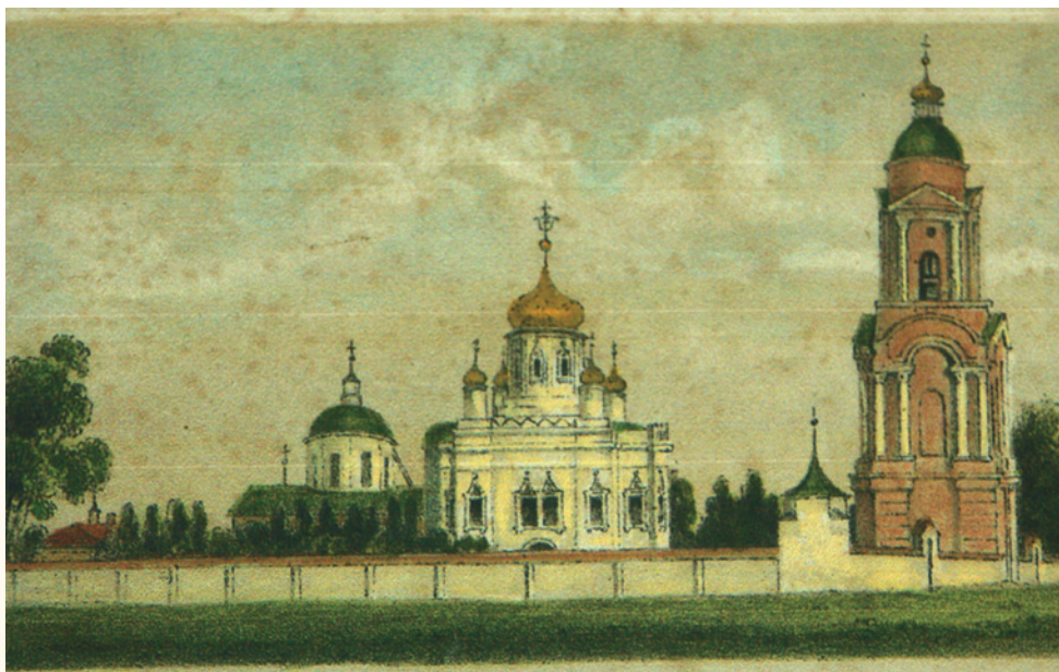
Спасо-Преображенский монастырь. Гравюра середины XIX в.