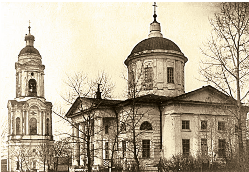
Колокольня и Спасо-Преображенский собор. 1920-х гг.