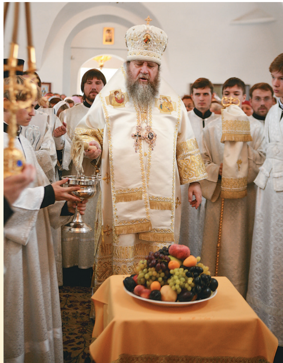
Освящение плодов. 19 августа 2010 г.