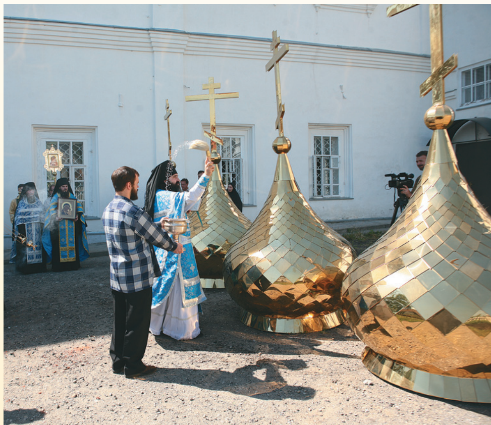
Освящение малых куполов. 21 июля 2010 г.

стырь. Одна из старейших монашеских обителей Пензенского края вновь заняла достойное место среди святых мест области. Обязанности наместника были возложены на иеромонаха Нестора (Люберанского), первым духовником возрож-