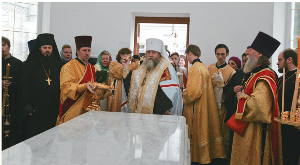
Освящение часовни. 26 сентября 2013 г.