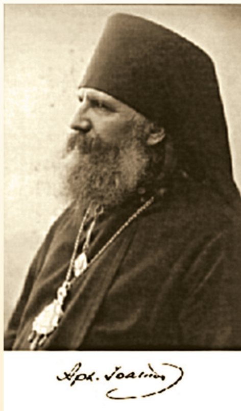
Архиепископ Иоанн (Поммер)

Скорее всего, именно в Спасо-Преображенской обители в 1920 г. Пресвященный Иоанн рукоположил во диаконы старца Иоанна Оленевского (Ивана Васильевича Калинина, ок. 1862-1951), будущего священноисповедника, и здесь же тот проходил сорокоуст. Последний настоятель монастыря архимандрит Иоанникий был духовником старца.